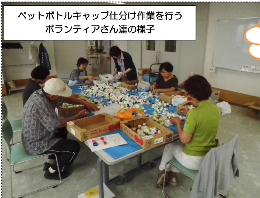
ペットボトルキャップ仕分け作業を行うボランティアさん達の様子