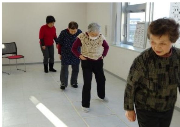
コグニサイズ（ラダー使用）の様子