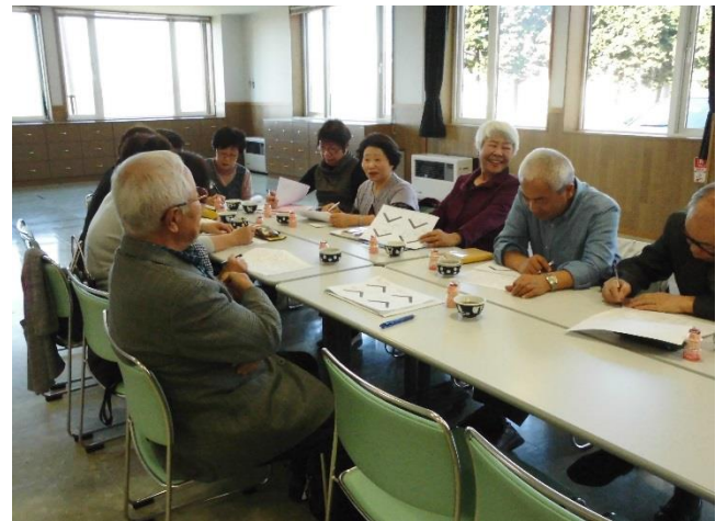
座談会に参加されたサロン活動実践者のみなさん

社会福祉法人 洞爺湖町社会福祉協議会 洞爺湖町ボランティアセンター 《本 所》〒049-5604 洞爺湖町栄町 63-1 健康福祉センターさわやか内 【TEL】 0142-76-4363 【FAX】 0142-76-4368 【E-mail】 toyako-sha.abuta@jupiter.ocn.ne.jp 《洞爺支所》〒049-5802 洞爺湖町洞爺町 132-2 洞爺ふれ愛センター内 【TEL】 0142-82-5185 【FAX】 0142-82-5895 【E-mail】 toyakosha_toya_tsutsuji@theia.ocn.ne.jp ホームページ : http://toyako-shakyo.org