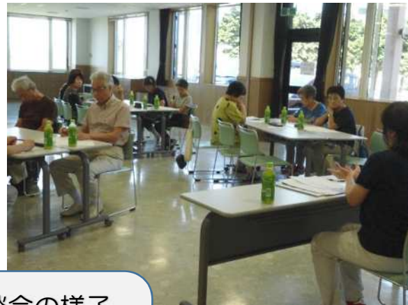
研修会・座談会の様子