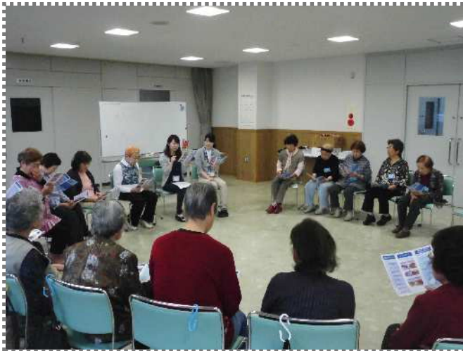
保健師さんを交えて、健康談義！