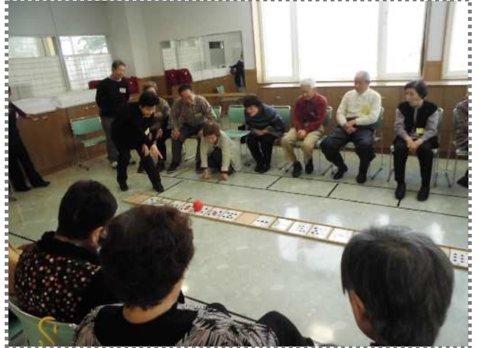
色々なゲームでリフレッシュ！