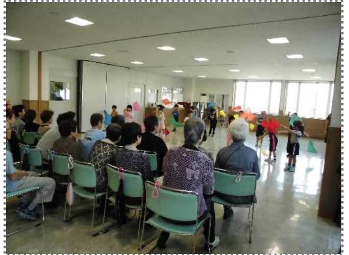
保育所の子ども達も遊びに来られます！