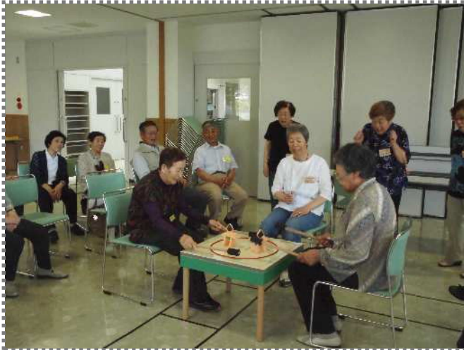
夏場所に合わせて、相撲のゲーム！