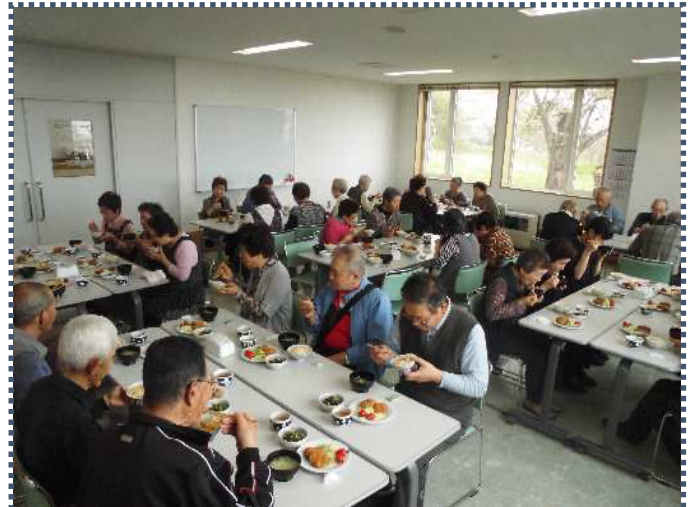
ボランティアさん手作りのおいしい食事をみんなでいただきます！