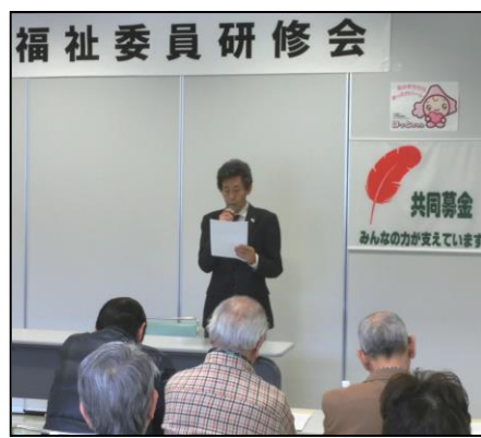
山浦会長による実践発表