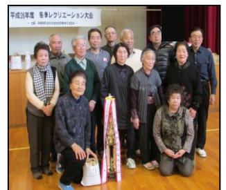
優勝した成香Aチーム