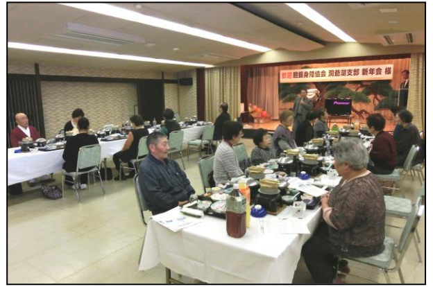
平成26年度新年会の様子