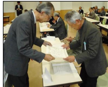
（写真：胆老連総会開催時での表彰式の様子）