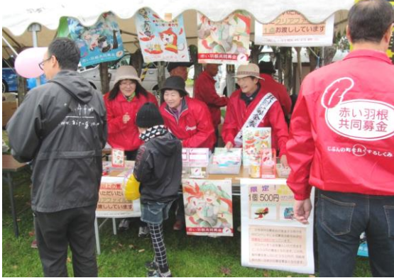
昨年度街頭募金の様子 (月浦ワイン&グルメ祭り 10月)