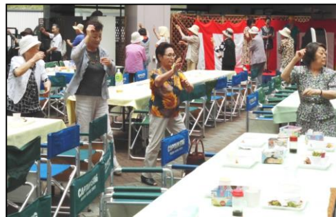
写真：盆踊りの様子

当日は食事や演芸発表、同連合会から福祉館様へタオル170本の贈呈、恒例の盆踊りなどが行われ、交流を深め、賑わいました。