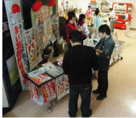
赤い羽根共同募金PR活動の様子 (TOYAKO アニメ・マンガフェスタ 2017 6月)