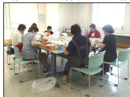
写真：収集していただいたキャップの仕分作業の様子

広報「社協だより」・ボラセン情報誌「はつらつ号」にご意見・ご感想をお寄せください。