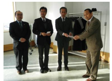
洞爺ライオンズクラブ様