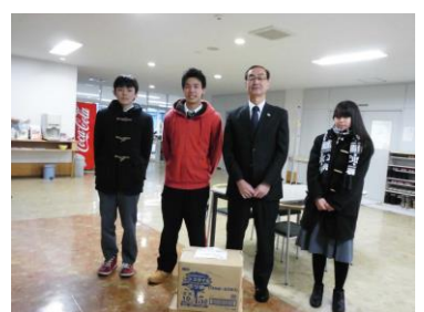
虻田高校ボランティア委員会様