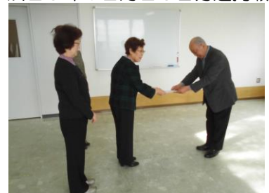
ななかまどの会様