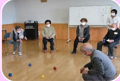
ふれ愛クラブ(洞爺地区)レクリエーションの様子