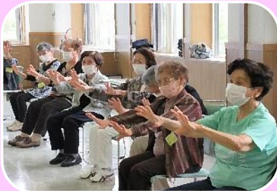
ふれあい交流会(虻田地区)体操の様子