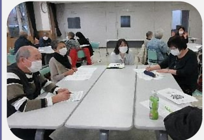
「手助け隊」活動者研修会及び座談会の様子