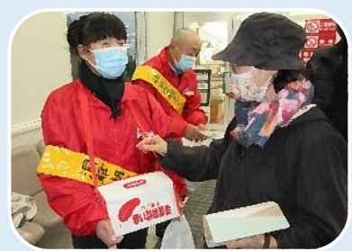
伊達地区保護司会洞爺湖町第一分区による街頭募金の様子