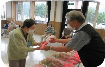
お誕生日会での花束贈呈