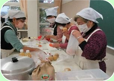
防災学校での非常食作りの様子