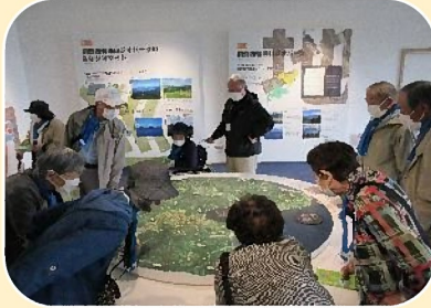
視察研修旅行の様子